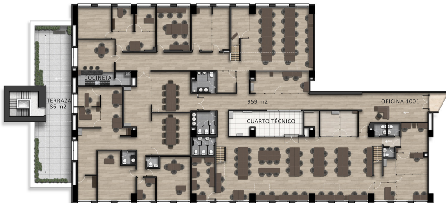
PLANTA OFICINA 1001 PRIMER PISO (959 m2)